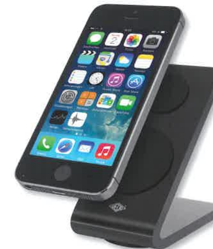
Der Mobile-Office-Bereich gewinnt auch bei Wedo immer mehr an Bedeutung, wie etwa die Stand-by-Tablet- und Smartphone-Ständer mit einer innovativen Haftung.

staut werden. Der Saunders Slim-Mate aus widerstandsfähigem Kunststoff zeichnet sich dadurch aus, dass er besonders flach und